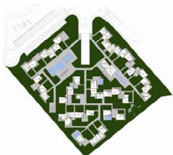
Immagine 02 (Piano Terra)