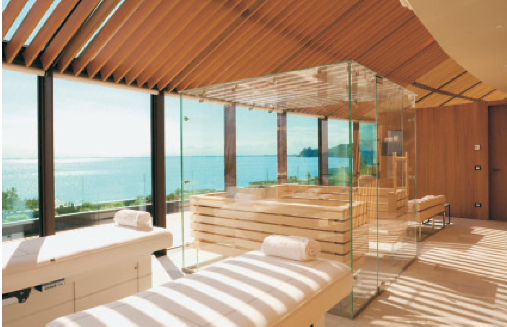
Le grandi vetrate alleggeriscono la struttura