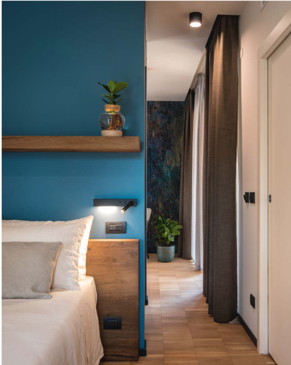
In queste pagine, le calde atmosfere delle ambientazioni, frutto di un attento studio sui materiali utilizzati.

il parco circostante, grazie alle ampie vetrate, alle terrazze di pertinenza e ai patii interni, che preservano gli alberi secolari.