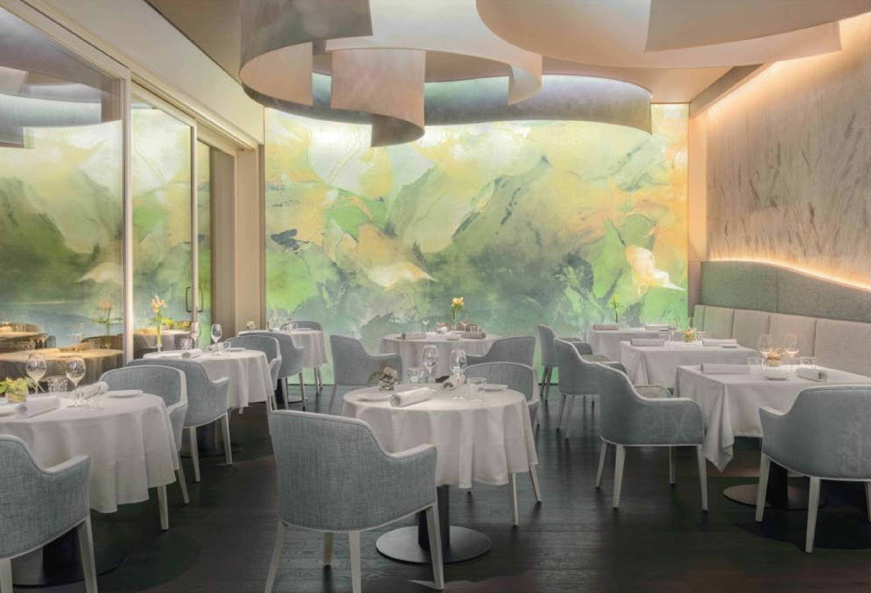
this page, 그라덴(Gramen)레스토랑은 차분한 색상의 가구와 주변 자연에 경의를 표하는 월페이퍼, 정밀한 조명 디자인 및 언급적인 조명 효과를 결합했다.