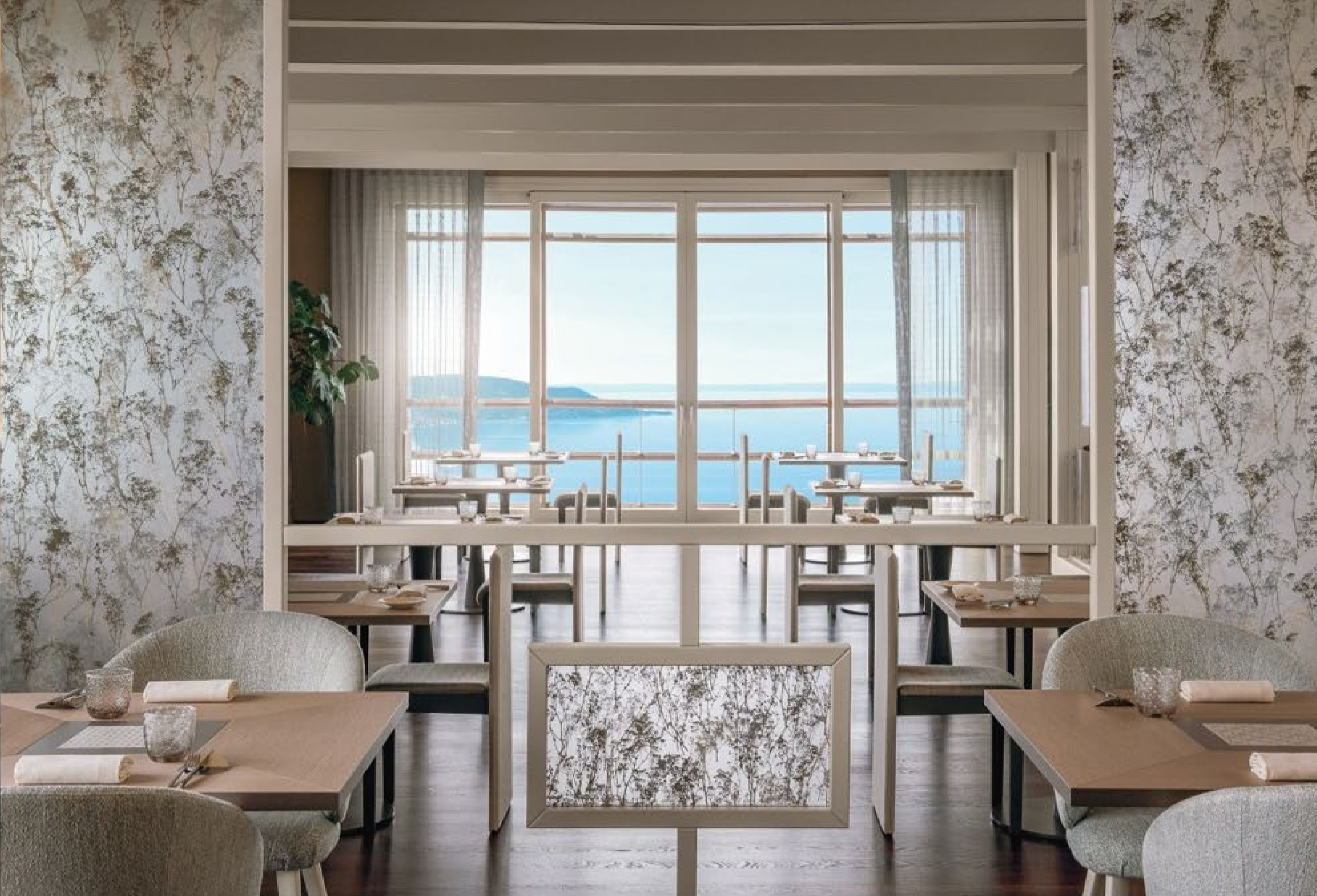
this page_top, 라 리모니아(La Limonia) 레스토랑은 가벼운 디자인 구조와 나무 기둥, 난간의 기하학적 높이로 감율 재배의 지역 전통을 참조했다. this page_bottom, 라운지 바(Lounge Bar)는 세련된 분위기와 짙은 색상, 은은한 조명이 어우러진 F&B를 완성했다.