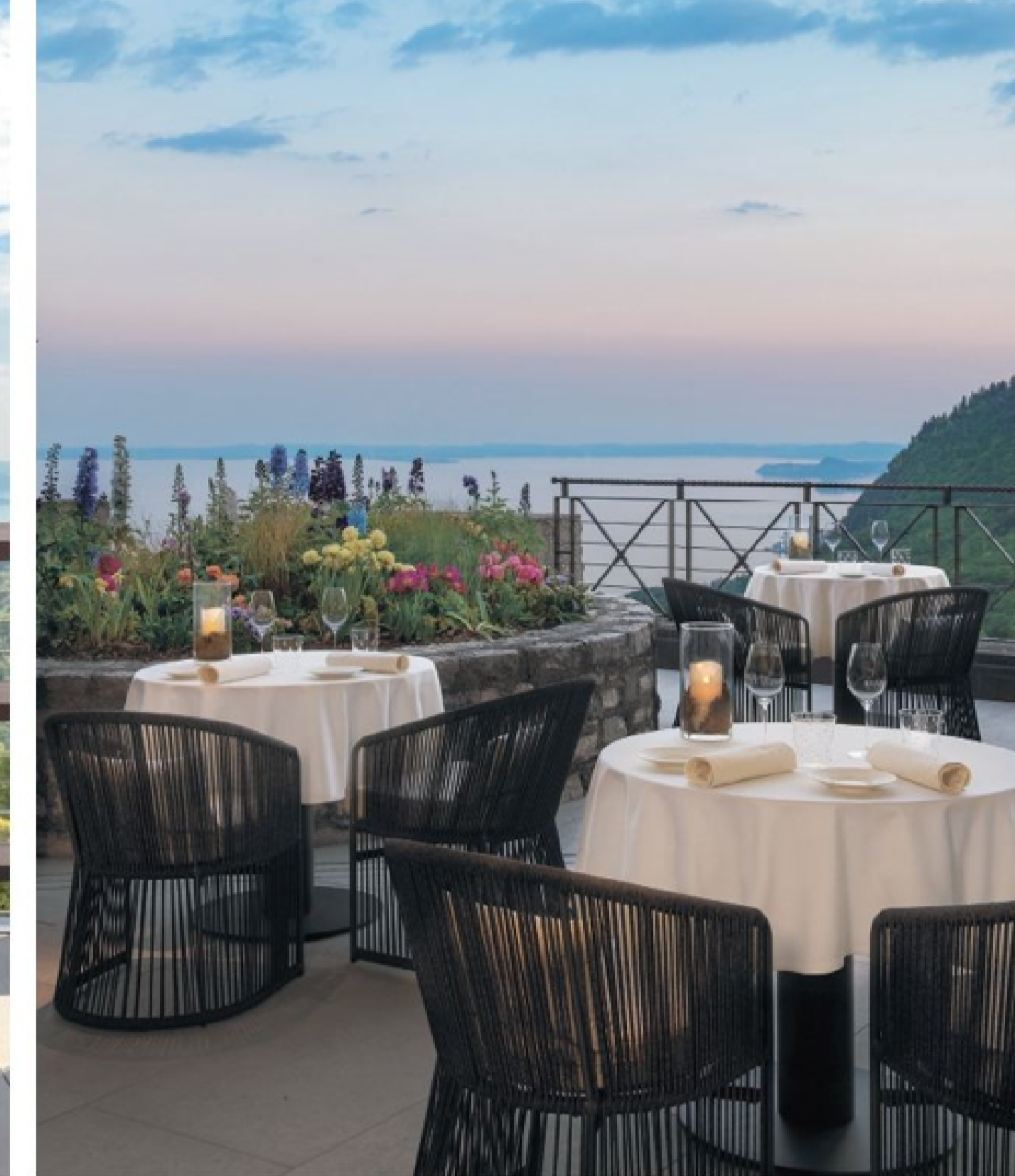
this page. 테라스에서는 아름다운 롬바르드 호숫가를 내려다볼 수 있다.