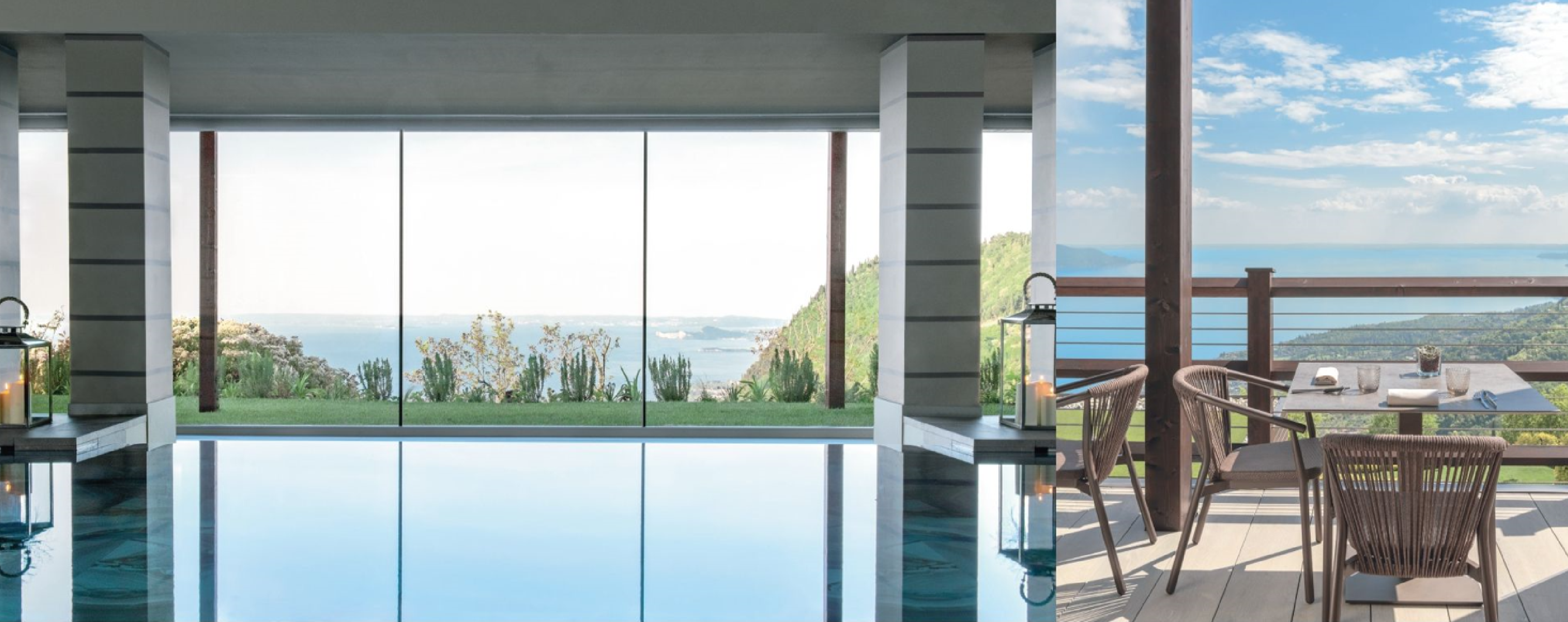
previous page. 큰 창과 테라스는 자연 채광과 조화를 이루는 균형 잡힌 조명뿐만 아니라 지역 재료, 중성 및 부드러운 색상을 사용하여 외부와 내부 간의 지속적인 대화를 촉진한다. this page. 기르다 호수가 내려다보이는 탁 트인 사우나와 인파티너 풀이 있는 '성인 전용 SPA' 공간이 4,300㎡의 스파 및 웰빙 공간을 형성한다.