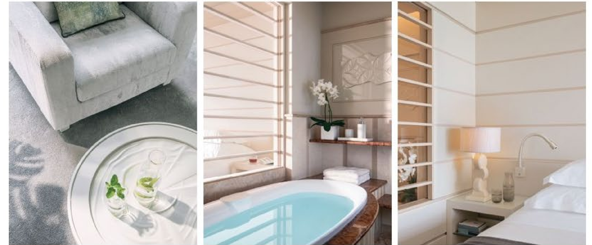
this page, 객실마다 최대 600㎡의 전용 사우나와 자쿠지가 마련되었다.