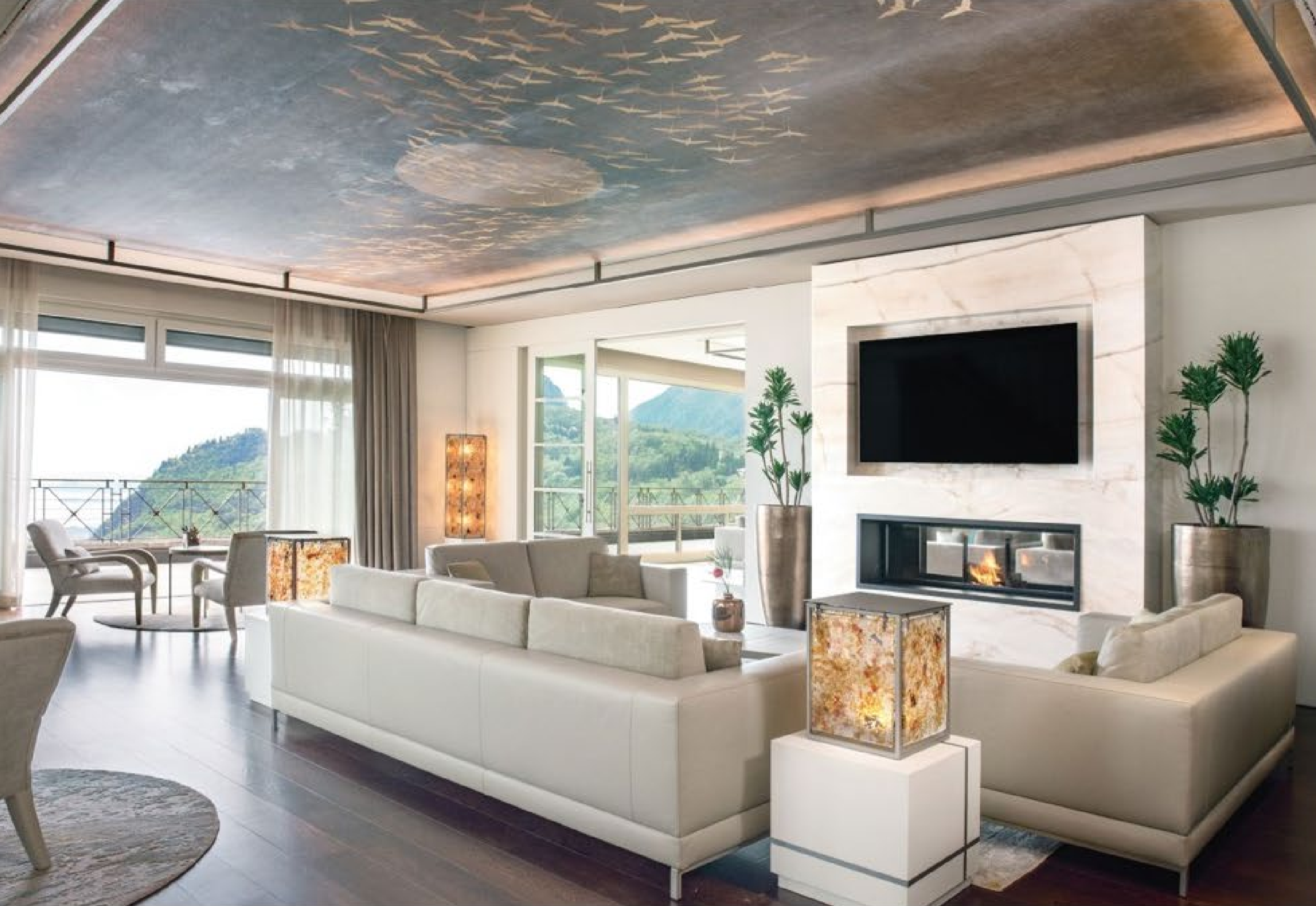
this page_top, 6가지 유형의 스위트룸은 수공예 직물과 현지 재료로 장식된 넓은 객실을 제공한다. this page_bottom, 인테리어의 독특한 특징은 벽을 따라 이어지는 대조적인 수평 스트라이프 패턴과 가구, 방 사이의 칸막이에서 볼 수 있다.