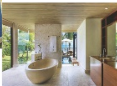
Abtauchen leicht gemacht: in der gediegenen Pool-Landschaft oder im lichten Iridium-Spa

Das „The St. Regis Mauritius Resort“ befindet sich an der Südwestküste von Mauritius: am Fuße des Berges Le Morne Brabant, der sich vor dem Türkis des Indischen Ozeans und den Puderzuckerstränden erhebt. Das Hotel mit seinem großzügig angelegten Areal verströmt koloniales Flair. Besonders ist das Konzept des Iridium-Spas auf 2000 Quadratmetern (mit zusätzlichen 946 Quadratmetern Manor-House-Spa-Suites), denn die luxuriösen Treatments und Massagen kann man auch im eigenen Zimmer genießen. marriott.de