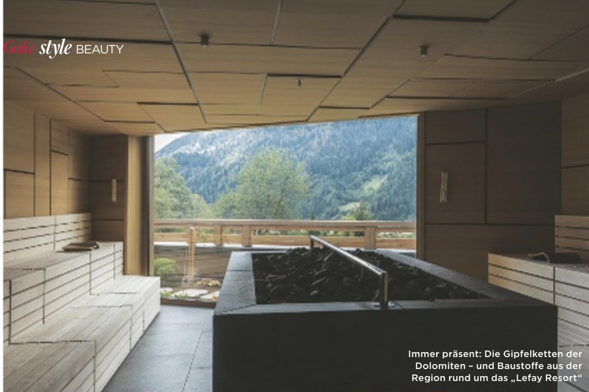
Immer präsent: Die Gipfelketten der Dolomiten – und Baustoffe aus der Region rund um das „Lefay Resort“