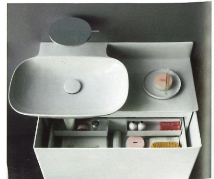
Ino, de Laufen.