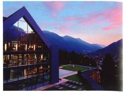
Lefay Resort.

En más de veinte años de actividad, Studio Apostoli ha llevado a cabo más de 1.000 proyectos incluyendo hoteles, spas, oficinas, comercios, complejos residenciales y villas, proporcionando arquitectura, ingeniería e interiorismo, así como concibiendo muebles, productos y accesorios diseñados específicamente para cada proyecto. De gran a pequeña escala, el bienestar se expresa a través de una metodología de diseño integrada y evoluciona continuamente, gracias a las innovaciones tecnológicas y las experiencias internacionales adquiridas por la firma. Estados Unidos, Europa, Rusia, Oriente Medio y China son algunos de los mercados mundiales en los que Alberto Apostoli ha trabajado y comunicado sus conocimientos, a través de conferencias y actividades educativas.