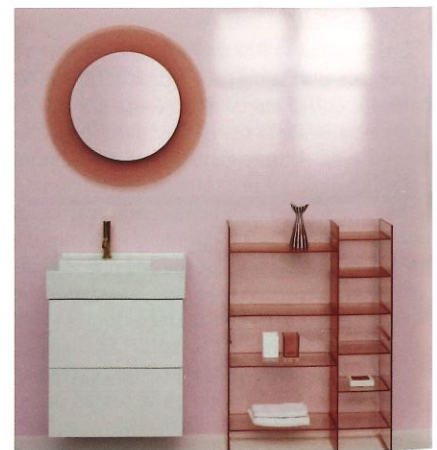
Kartell by Laufen.

a acompañar en este ritual y tenlos todos al alcance de tu mano para disfrutar del mejor momento del día con un buen libro, música relajante o, incluso, una copa de vino.